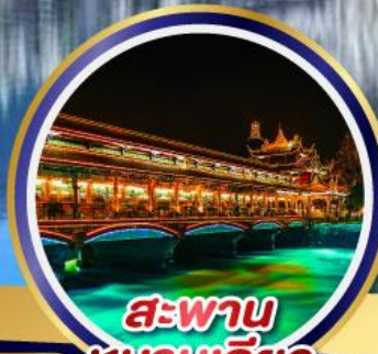
สะพาน หนานเจียว