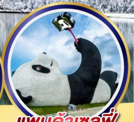
แพนด้าเซลฟี