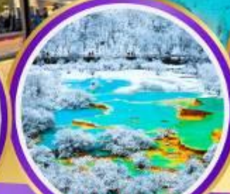
ชอยกว้างชอยแคบ