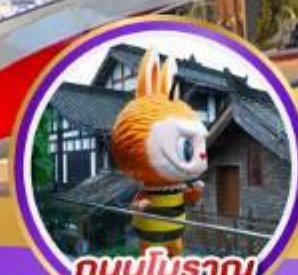
ถนนโบราณ