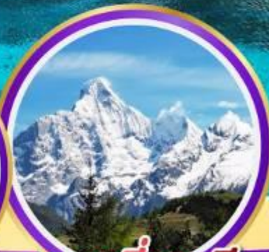
กุเวาสีครุณี