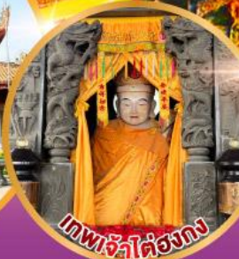
เทพเจ้าไต้ฮงกง