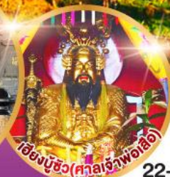
เซียงมูซิว (ศาลเจ้าพ่อเสือ)