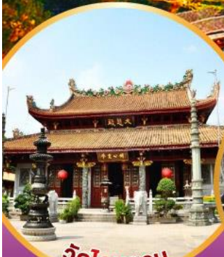
วัดโคทหยวน