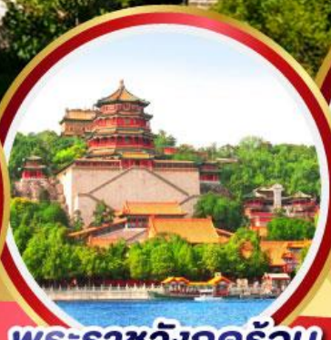
พระราชวังฤดูร้อน อี้โฮหยวน