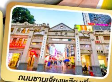
ถนนชานเจียงเหลียงเซียง