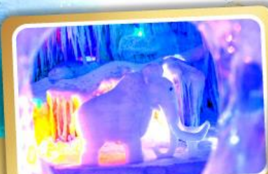
ตำนานแห่งหลงก