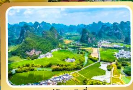
หมู่บ้านหมิงซี