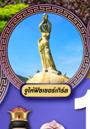
จูไห่พิซเซอร์รี่