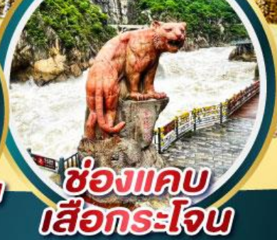
ช่องแคบ เสือกระโจน