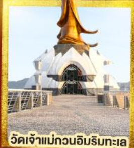
วัดเจ้าแม่กวนอิมริมทะเล