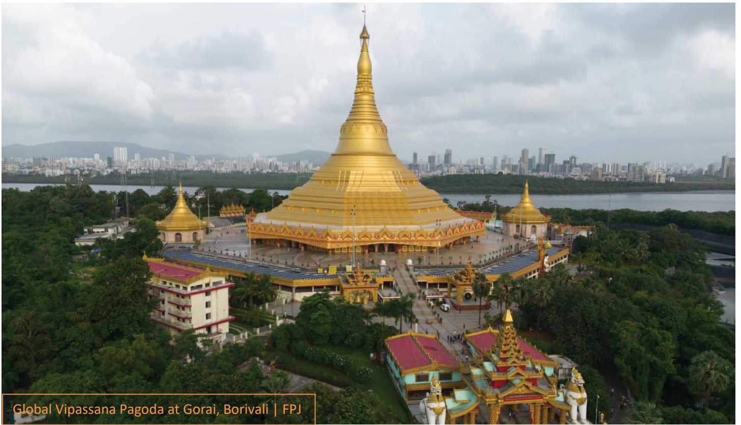
Global Vipassana Pagoda at Gorai, Borivali