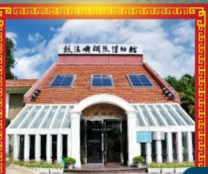
เกาะเปียวโน