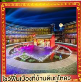
โชว์พื้นเมืองที่บ้านดินถูไหลอ