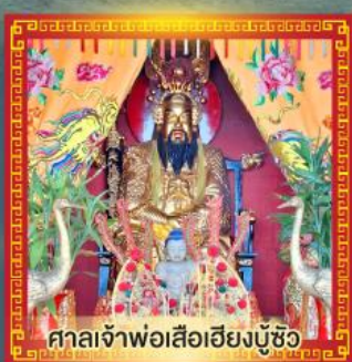
ศาลเจ้าพ่อเสือฮยงบูซิว