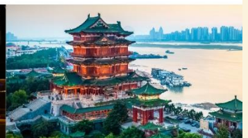
หอเจ๋งหวัง

*ทางบริษัทฯ ขอสงวนสิทธิ์ในการสลับโปรแกรมทัวร์ตามความเหมาะสมขึ้นอยู่กับสถานการณ์หน้างาน โดยคำนึงถึงผลประโยชน์ของลูกค้าเป็นสำคัญ