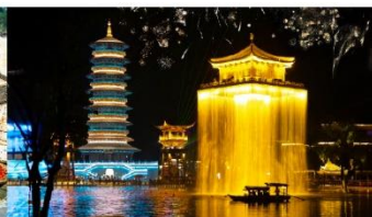
ล่องเรืออู่หนี่โจว