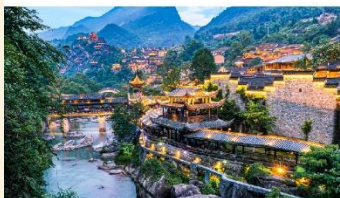
หุบเขาเทวดาฉางเซียนกู่