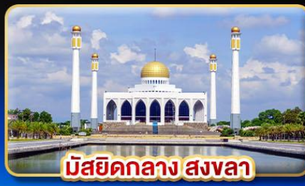
มัสยิดกลาง สงขลา