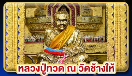
หลวงปู่ทวด ณ วัดช้างไห้