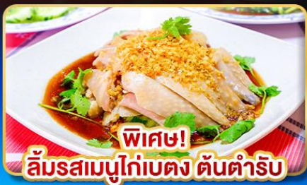
พีช! ลิ้มรสเมนูไก่เบตง ตันตำริบ