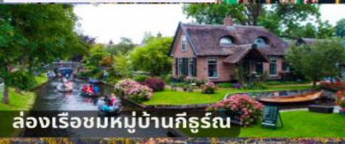
ล่องเรือชมหมู่บ้านคีร์รุณ

สายการบินการตาร์แอร์เวย์ บินเข้า อัมสเตอร์ดัม บินออก ปารีส นำหมักระเบิด 25 กก.