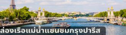
ล่องเรือแม่น้ำแซนชมกรุงปารีส