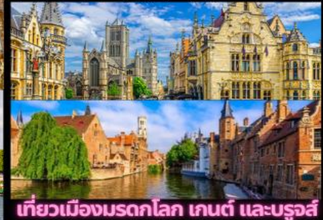
เที่ยวเมืองมรดกโลก เกนต์ และบรูจส์