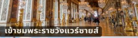
เข้าชมพระราชวังแวร์ซายส์