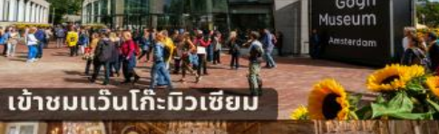
เข้าชมแวนโก๊ะมิวเซียม