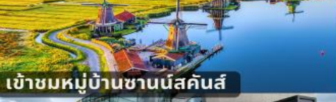
เข้าชมหมู่บ้านชานันส์คันส์