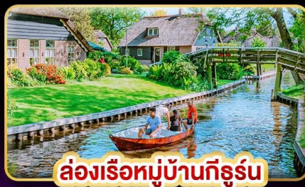
ล่องเรือหมู่บ้านกังหัน