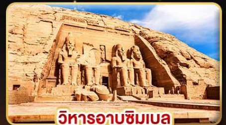
วิหารอาบูซิมเบล

🧳 น้ำหนักกระเป๋า 23Kg. (บินระหว่างประเทศ และบินภายใน)