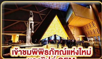
เข้าชมพิพิธภัณฑ์แห่งใหม่ ของอียิปต์ GEM

ชม 1 ใน 7 สิ่งมหัศจรรย์ของโลก “มหาพีระมิดแห่งกิซ่า”