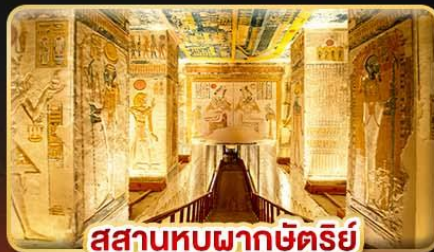
สุสานหุบผากษัตริย์