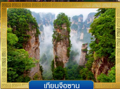
เทียนจื่อซาน

✓ นั่งกระเช้าขึ้นสู่... ภูเขาประตูล่องเรือ