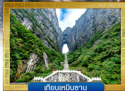
เทียนเหมินซาน