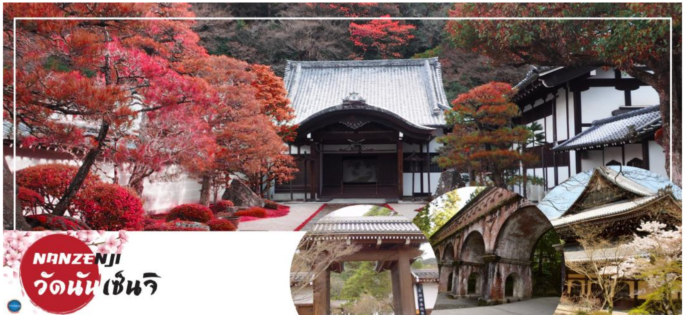
NANZENJI วัดนันเซ็นจิ

สาม เมืองโอซาก้า – เมืองเกียวโต – วัดนันเซ็นจิ – การเรียนพิธีชงชาญี่ปุ่น – วัดกินคะคุจิ