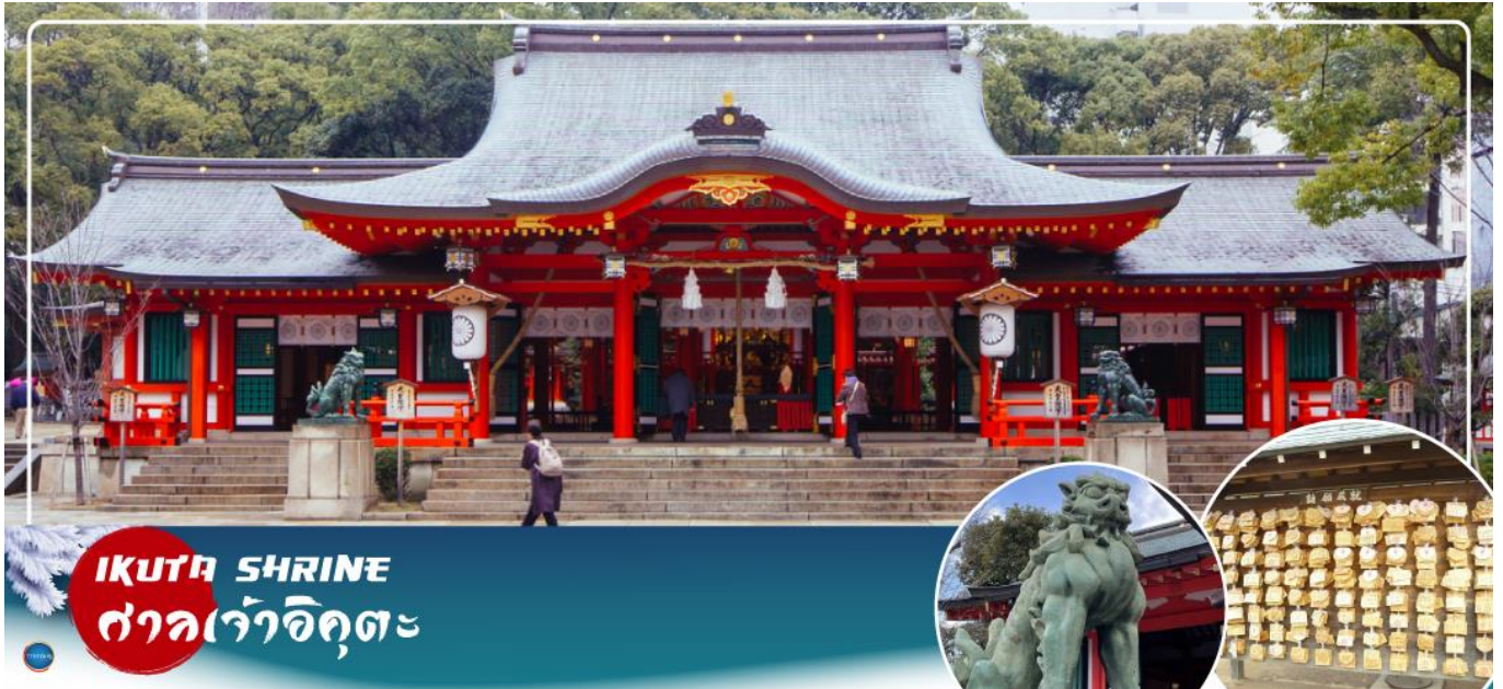
IKUTA SHRINE ศาลเจ้าอิคุตะ

จากนั้นนำท่านสักการะ ศาลเจ้าอิคุตะ (Ikuta Shrine) ตั้งอยู่ในย่านใจกลางเมืองซันโนะมียะ (Sannomiya) เป็นศาลเจ้าที่มีประวัติศาสตร์ยาวนาน ก่อตั้งในปี 201 หนึ่งในสามศาลเจ้าหลักของโกเบที่มีประวัติศาสตร์ยาวนานกว่า 1,800 ปี ทางเหนือไปตามถนนช็อนนอิคุตะ คุณจะเห็นทางเข้าศาลเจ้าพร้อมประตูโทริอิที่สร้างโดยใช้วัสดุรีไซเคิลจากศาลเจ้าใหญ่ฮิเอะ ศาลเจ้าอิคุตะมีชื่อเสียงในด้านผลประโยชน์ในการจับคู่ เนื่องจากจิคาอิ อนนะซันเป็นเทพเจ้าผู้ทอเสื้อผ้าของเทพเจ้า และเธอทอด้วยและด้ายเข้าด้วยกัน คนในพื้นที่เรียกกันอย่างเสนาหว่า "อิคุตะซัง"