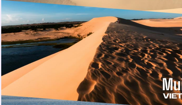
Mui Ne VIETNAM