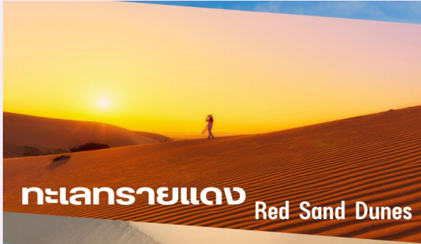
ทะเลทรายแดง Red Sand Dunes