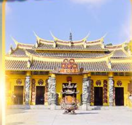
วัดซอพรเทพเจ้า