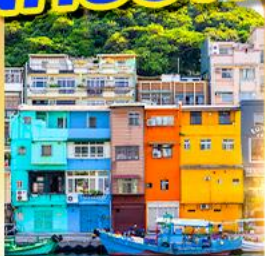
หมู่บ้านประมงเจินปิง