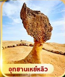
อุทยานเหย์หลิว