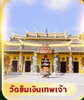
วัดยิมเงินเทพเจ้า