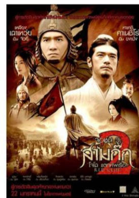
ภาพยนตร์และซีรีส์ชื่อดัง ถ่ายทำที่ Hengdian World Studios