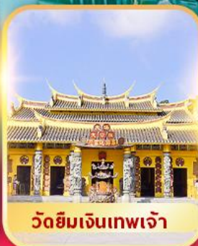
วัดยิมเจินเทพเจ้า