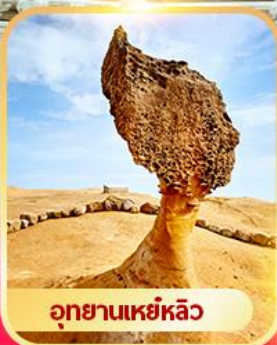
อุทยานเหย์หลิว