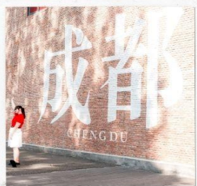
CHENGDU EASTERN MEMORY