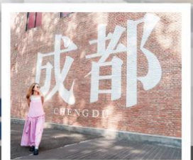
CHENGDU EASTERN MEMORY