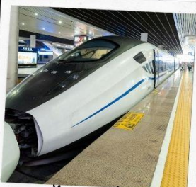
รถไฟความเร็วสูง สู่จี้จ้ายโกว