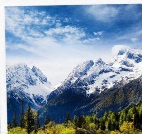
ภูเขาหิมะการ์เซีย ต้ากู่ปิงชวหน