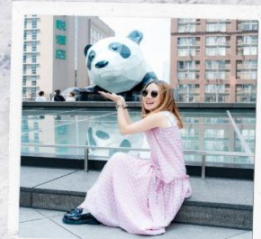
IFS แพนด้าปีนตึก