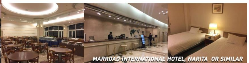
MARROAD INTERNATIONAL HOTEL, NARITA OR SIMILAR