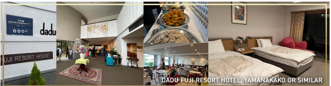
DADU FUJI RESORT HOTEL, YAMANAKAKO OR SIMILAR