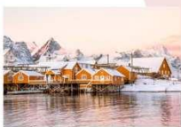
หมู่บ้าน Sakrisoy