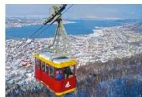
Tromsø Cable Car

** ที่พัก CLARION HOTEL THE EDGE OR SIMILAR **