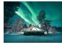
Glass Igloo Hotel

** พักที่ NORTHERN LIGHTS VILLAGE OR SIMILAR **