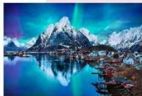
หมู่เกาะโลโฟเทน

00.00 น. ออกเดินทางสู่ เมืองเลกเนส โดยสายการบิน Scandinavian Airlines เที่ยวบินที่ SK 4106 แวะเปลี่ยนเครื่องที่เมือง Bodo เป็นสายการบิน Wide roe WF 810 00.00 น. เดินทางถึงสนามบินเมืองเลกเนส