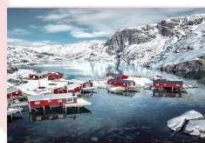
หมู่บ้าน Nusfjord

** พักที่ ELIASSEN RORBUER OR SIMILAR **