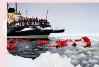
ล่องเรือตัดน้ำแข็ง Ice Breaker