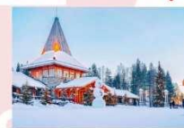
หมู่บ้านซานต้าครอส

15.25 น. ออกเดินทางสู่อิสตันบูล ประเทศตุรกี เที่ยวบินที่ TK 1750 21.10 น. เดินทางถึงสนามบินอิสตันบูล (แวะเปลี่ยนเครื่อง)