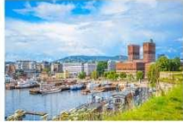
เมืองออสโล

06.10 น. เดินทางถึงนครอิสตันบูล ประเทศตุรกี (แวะเปลี่ยนเครื่อง) 09.00 น. ออกเดินทางสู่กรุงออสโล ประเทศนอร์เวย์ เที่ยวบินที่ TK 1751 11.00 น. เดินทางถึงสนามบินสนามบินเมืองออสโล