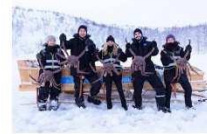
สนุกกับกิจกรรมจับปูยักษ์

00.00 น. ออกเดินทางสู่ เมืองคีร์กเคนส โดยสายการบิน...เที่ยวบินที่... 00.00 น. เดินทางถึงสนามบินเมืองคีร์กเคนส