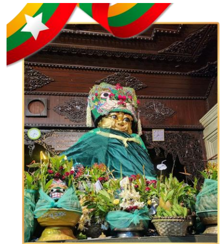
พามู “แม่ยักษ์” ตัดกรรม

*พามู “แม่ยักษ์” คนพม่าเชื่อว่าแม่ยักษ์จะช่วยในการตัดกรรมจากเจ้ากรรมนายเวร ให้ชีวิตของคุณมีแต่ดีขึ้นเรื่อยๆ และยังช่วยเรื่องความมีชื่อเสียงโด่งดัง เป็นที่รู้จักในหน้าที่การงาน