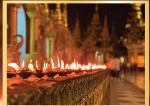
ถวายประทักษิณ พระมหาเจดีย์ชเวดากอง 999 ดวง