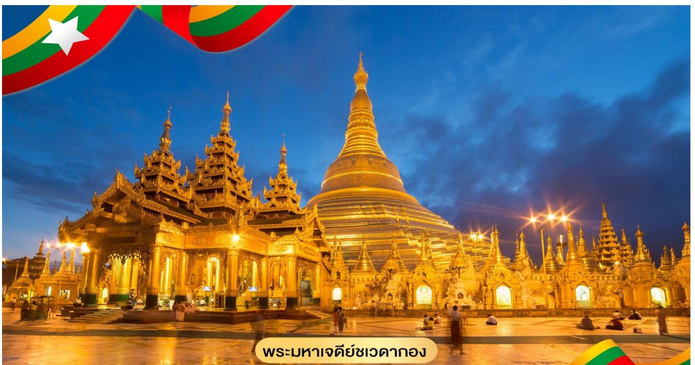
พระมหาเจดีย์ชเวดากอง