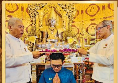
ร่วมพิธีเทโวพระธาตุ ณ เจดีย์กาบาอ