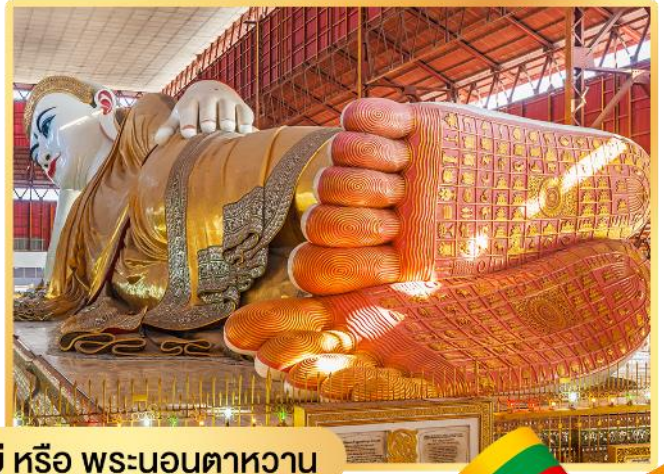
พระพุทธรูปไสยาสน์เจาทัตยี หรือ พระนอนตาหวาน

นำท่านสักการะ พระพุทธรูปไสยาสน์เจาทัตยี หรือ พระนอนตาหวาน นมัสการพระพุทธรูปนอนที่มีความสวยที่สุด มีขนตาที่งดงาม พระบาทมีภาพมงคล 108 ประการ และพระบาทซ้อน กัน ซึ่งแตกต่างกับศิลปะของไทย จากนั้นนำท่านสักการะ เจดีย์โบตาทาวน์ สร้างโดยทหารพม่า เพื่อบรรจุพระบรมธาตุที่พระสงฆ์อินเดีย 8 รูป ได้นำมาเมื่อ 2,000 ปีก่อน ในปี 2466 เจดีย์แห่งนี้ถูกระเบิด ของฝ่ายสัมพันธมิตร เข้ากลางองค์ จึงพบโกศทองคำบรรจุพระเกศาธาตุ และ พระบรมธาตุอีก 2 องค์ และพบพระพุทธรูปทองเงิน สำริด 700 องค์ และจารึกดินเผา ภาษาบาลี และตัวหนังสือพราหมณ์อินเดียทางใต้ ต้นแบบ ภาษาพม่าภายในเจดีย์ ประดับด้วยกระเบื้องสีล้วน งดงาม และมีมุมสำหรับฝึกสมาธิหลายจุด ในองค์พระเจดีย์