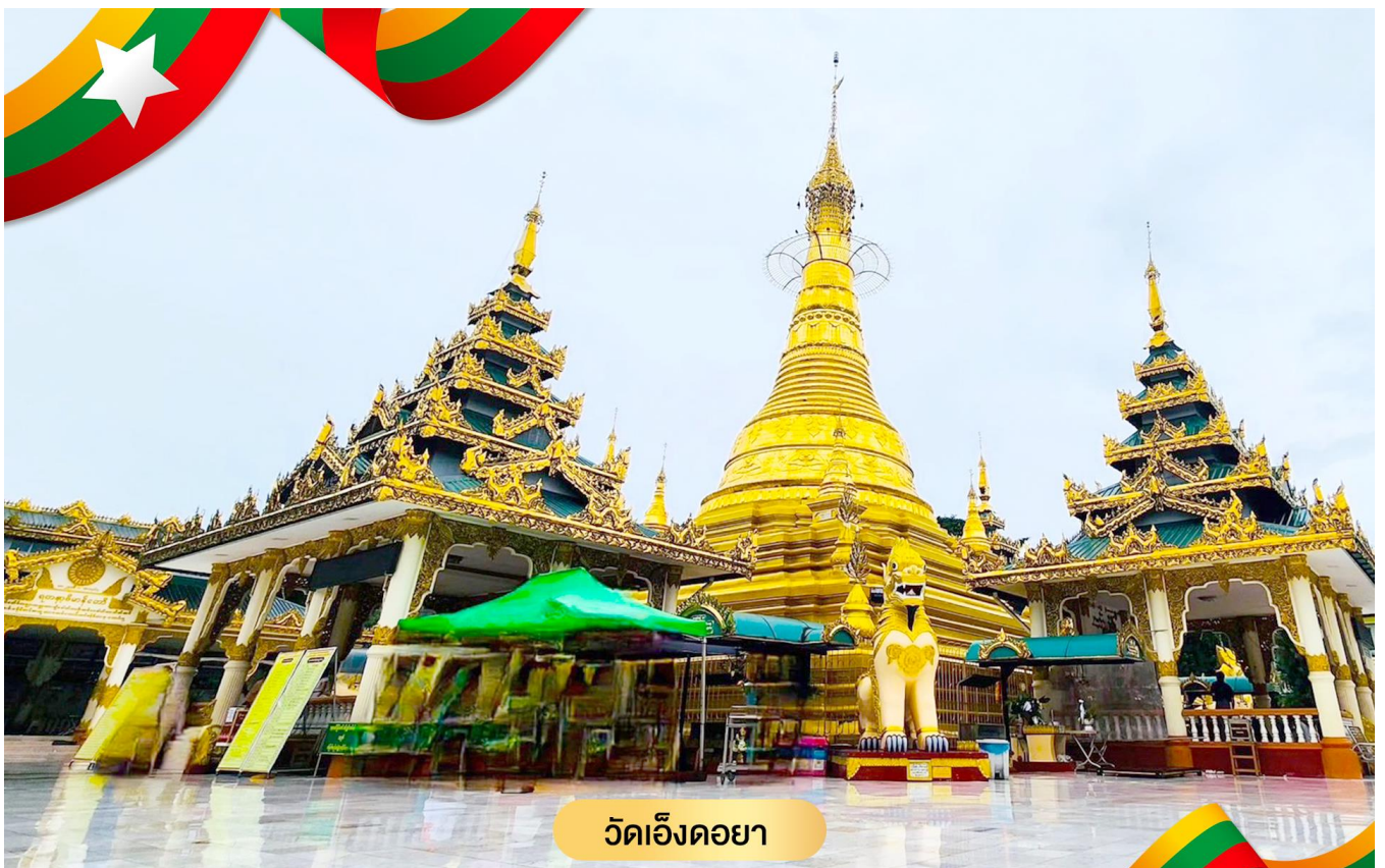
วัดเอ็งตอยา

นำท่านเดินทางไปยัง วัดเอ็งตอยา วัดแห่งนี้ที่ชื่อเสียงอย่างมาก ในการขอพร เกี่ยวกับเรื่อง อสังหาริมทรัพย์ เช่น ใครที่ต้องการ ซื้อขาย บ้าน- ที่ดิน หรือลงทุนทำธุรกิจ ก็มักจะเดินทางมาขอพรที่วัด แห่งนี้เป็นจำนวนมาก