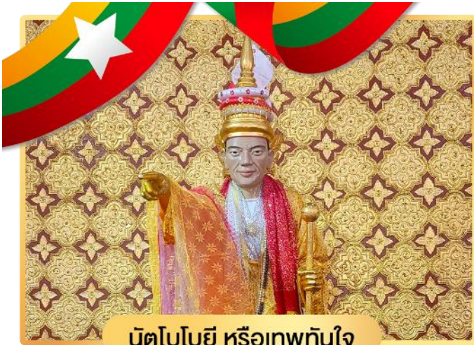
นิตโบโยยี หรือเทพทันใจ

การเคารพและบูชาเทพกระซิบ จะบูชาด้วยน้ำนม ข้าวตอก และผลไม้ และกระซิบเพื่อขอพรท่าน ซึ่งเมียะนานหน่วยนั้น ถือได้ว่าเป็นเทพที่ให้แต่พรและความโชคดีแก่ทุกๆคนที่มาขอพร