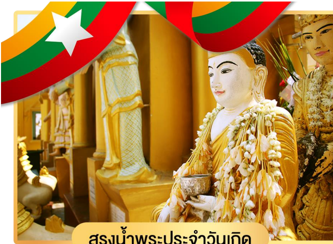
สรงน้ำพระประจำวันเกิด

นอกจากนี้ รอบองค์เจดีย์ยังมีพระประจำวันเกิดประดิษฐาน ทั้งแปด ทิศรวม 8 องค์ หากใครเกิดวันไหน ก็ให้ไปสรงน้ำพระประจำวันเกิด ตนจะเป็นสิริมงคล แก่ชีวิต