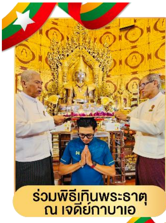
ร่วมพิธีเก็นพระธาตุน เจดีย์กาบาเอ

นำท่านสักการะ พระเจดีย์กาบาเอ เป็นเจดีย์ทรงกลม มีทางเข้าทั้งหมดห้าด้าน ทุกด้านจะมีพระพุทธรูปประดิษฐานอยู่บนฐานทักษิณ มีพระพุทธรูปหุ้มด้วยทองคำ องค์เล็กๆอีก 28 องค์ แทนอดีตสาวกของพระพุทธเจ้า ทั้ง 28 องค์ มีความสูง และเส้นผ่าน ศูนย์กลางคือ 34 เมตร สร้างโดยนายอนุนายคนแรก ของพม่า เพื่อให้เป็นสถานที่สังคายนาพระไตรปิฎก ในปี ค.ศ. 1954 – 1956 และอุทิศ พระเจดีย์องค์นี้เพื่อให้เกิดการสร้าง สันติภาพขึ้นในโลก ภายในองค์พระเจดีย์บรรจุ พระบรมธาตุ มีพระอรหันต์สาวกองค์ สำคัญ สององค์ มีพระพุทธรูปองค์พระประธาน ที่อยู่ข้างในหล่อด้วยเงินบริสุทธิ์มีน้ำหนัก กว่า 500 กิโลกรัม