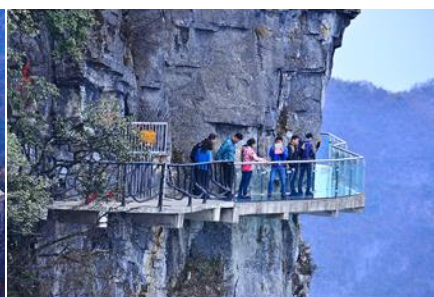
หน้าพลาวยี่ฟ้าทางเดินกระจก