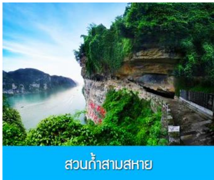
สวนถ้ำสามสหาย