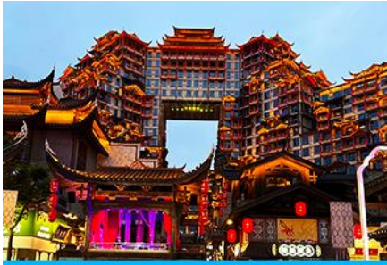
ตึกมหัศจรรย์ 72 ชั้น

พักที่ CHANGDE YUNXI HOTEL ระดับ 4 ดาวท้องถิ่น หรือเทียบเท่าในเมืองฉางเต๋อ