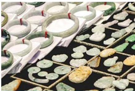
ศูนย์จำหน่ายผลิตภัณฑ์หยก

อัตราค่าบริการสำหรับโปรแกรมเสริมการแสดงชุด The love Story of Wooden man and Fairy Fox ท่านละ 400 หยวน (หรือ 2,000 บาทขึ้นอยู่กับอัตราแลกเปลี่ยน) ระยะเวลาที่ใช้ในการเที่ยวชมการแสดง ประมาณ 3 ชั่วโมง รวมเวลาเดินทางไป กลับค่าบริการรวม ค่าบัตรเข้าชม ค่ารถรับ ส่ง และค่าน้ำเที่ยวของไกด์ท้องถิ่น พักที่ ZHENMIAN HOTEL โรงแรมระดับ 4 ดาวหรือเทียบเท่า