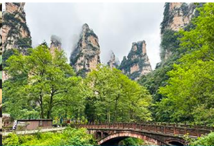
จุดชมวิวจินเปียนซี