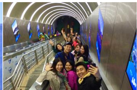
บันไดเลื่อนทะเลภูเขา