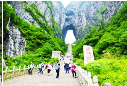
บันได 999 ขั้น