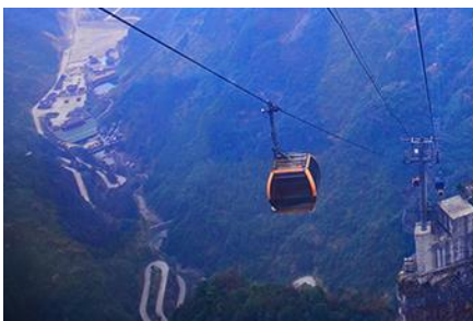
กระเช้าขึ้นเทียนเหมินซาน

https://hk.trip.com/hotels/guzhang-hotel-detail-68614854/chaxitai-holiday-hotel/