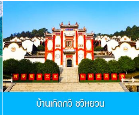
บ้านเกิดกวี ชวีหยวน