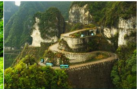
เส้นทาง 99 โค้ง