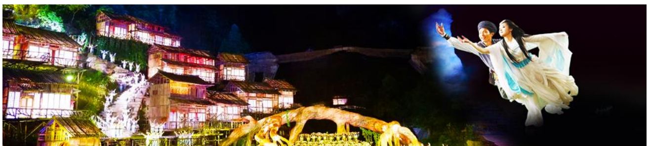
The Love Story of a Wooden Man and Fairy fox

จากนั้นท่านสามารถทดสอบกำลังขาของท่านโดยการเดินลงบันได 999 ขั้น เพื่อลงมายังลานกว้างที่เป็นจุดถ่ายรูปด้านล่างของประตูสวรรค์ ท่านที่ไม่ต้องการเดินบันไดลง สามารถใช้บันไดเลื่อนแทนการเดินลงบันได 999 ขั้น ณ ลานกว้างด้านล่างเป็นจุดถ่ายรูปที่ดีที่สุดที่สามารถมองเห็นเขาประตูสวรรค์ได้อย่างชัดเจน จากนั้นนำท่านนั่งกระเช้าลงจากเขาเทียนเหมินซาน