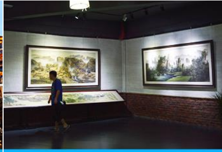
พิพิธภัณฑ์ภาพหินทราย