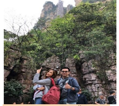
หมายเหตุ การเลือกซื้อ

ออฟชั่น ทางบริษัทขอสงวนสิทธิ์หากจำนวนผู้ซื้อไม่ถึง 15 ท่าน, ออฟชั่นนั้นไม่สามารถจัดให้ลูกค้าไปเที่ยวได้ จึงเรียนมาเพื่อให้ลูกค้าได้เข้าใจถูกต้องตรงกัน