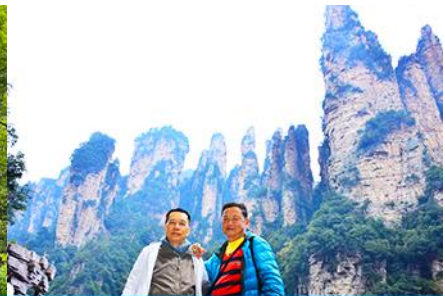
ชมจุดชมวิวลีฟท์แก้ว

วันที่ห้า เมืองจางเจียเจี๋ย – เลือกซื้อโปรแกรมทัวร์เสริมออฟชั่น อุทยานอวตารจุดชมวิวจินเปียนซี-ชมจุดชมวิวลีฟท์แก้ว - ร้านหยก-ร้านใบชา-เดินทางกลับเมืองหยีซัง