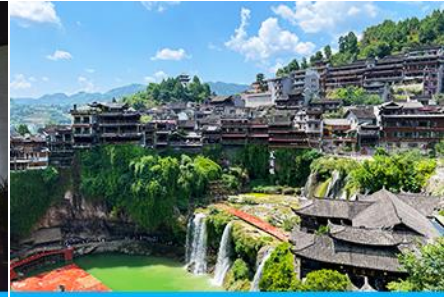
เมืองโบราณฝูหรงจิ้น