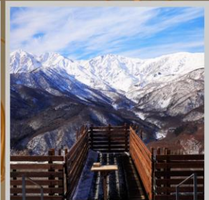
"HAKUBA MOUNTAIN HARBOR"