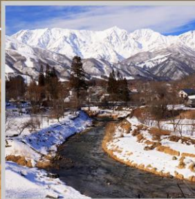
"HAKUBA OIDE PARK"