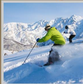
"HAKUBA SKI RESORT"