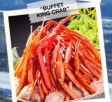
"BUFFET KING CRAB"