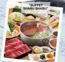
"BUFFET SHABU SHABU"