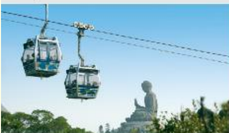
กระเช้ามองบึง