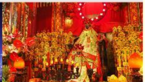
วัดเจ้าแม่กวนอิมสองฮา