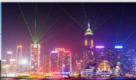
Symphony of Lights