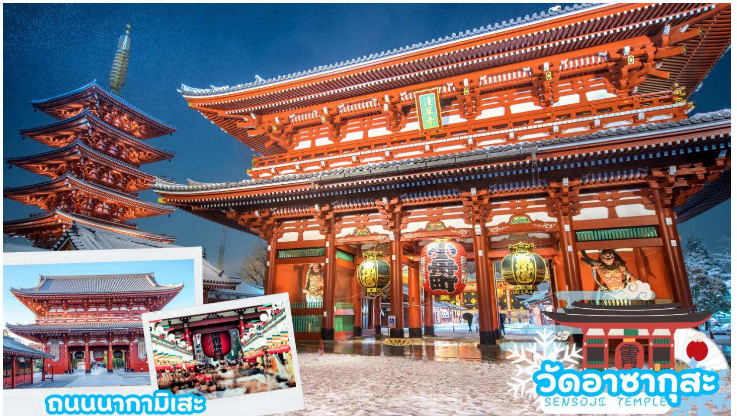
ถนนนากามิसे