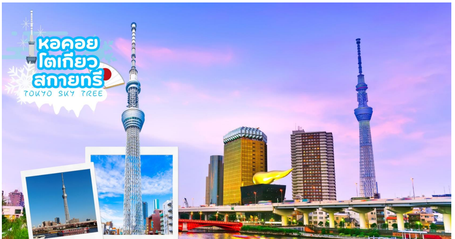
หอคอยโตเกียวสกายทรี TOKYO SKY TREE

เดินสู่ริมแม่น้ำซูมิดะ อิสระให้ท่านได้ถ่ายรูปเก็บภาพความประทับใจหอคอยที่สูงที่สุดในโลก หอคอยโตเกียวสกาย ทรี (Tokyo Sky tree) ที่เปิดเมื่อ 22 พฤษภาคม 2555 มีความสูง 634 เมตร และสามารถทำลายสถิติความสูงของหอคอยต่าง ในมณฑลกว่างโจว ซึ่งมีความสูง 600 เมตร กับ CN Tower ในนครโตรอนโต ของแคนาดา ที่มีความสูง 553 เมตร