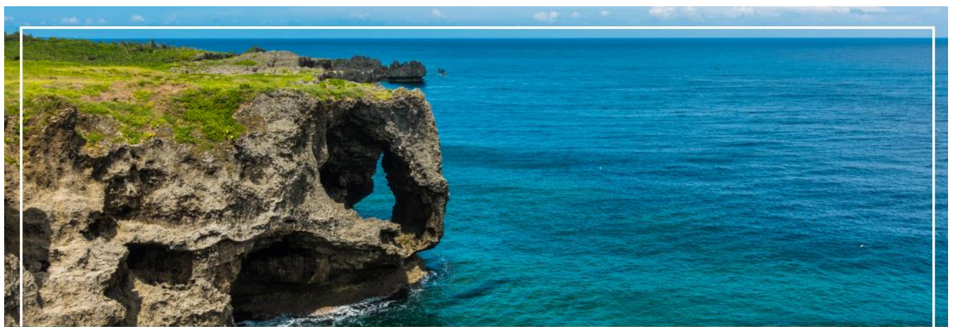
CAPE MANZAMO พามันซาโมะ

เที่ยง รับประทานอาหารกลางวัน ณ ภัตตาคาร (2)