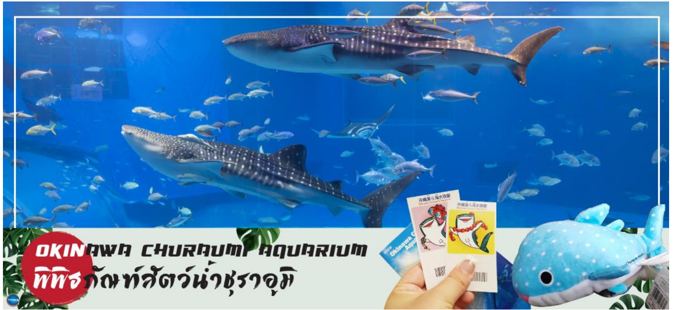
OKINAWA CHURAUMI AQUARIUM พิพิธภัณฑ์สัตว์น้ำชुरาอุมิ

เช้า รับประทานอาหารเช้า ณ ห้องอาหารของโรงแรม (1) นำท่านชม พิพิธภัณฑ์สัตว์น้ำชुरาอุมิ (OKINAWA CHURAUMI AQUARIUM) (ใช้เวลาเดินทางประมาณ 1.40 ชั่วโมง) เป็นพิพิธภัณฑ์สัตว์น้ำที่ดีที่สุดในประเทศญี่ปุ่น ไฮไลท์!!! ของการเยี่ยมชมพิพิธภัณฑ์สัตว์น้ำแห่งนี้คือแท็งก์น้ำคุโรชิโอะ ซึ่งเป็นหนึ่งใน แท็งก์น้ำที่ใหญ่ที่สุดของโลก ซึ่งภายในนั้นเต็มไปด้วยสิ่งมีชีวิตในทะเลแถบโอกินาวาที่หลากหลาย สัตว์น้ำที่โดดเด่นที่สุดคือฉลามวาฬยักษ์ และกระเบนราหู อีสระให้ท่านได้เพลิดเพลินกับสัตว์น้ำหลากหลายชนิด ทั้ง ปลาตาว ฉลาม ฉลามเสือ และฉลามวัว ปลาเรืองแสง ตลอดจนหอยต่างๆ นอกจากนี้ยังมีสระน้ำกลางแจ้งที่ตั้งอยู่ใกล้ริมน้ำซึ่งเป็นที่จัดการแสดงของโลมาแสนรู้ เต่าทะเล และพะยูน ที่จัดขึ้นเพียงไม่กี่ครั้งต่อวัน (ไม่มีค่าใช้จ่ายเพิ่มเติม แต่ต้องตรวจสอบเวลาการแสดงก่อนชมนะคะ)