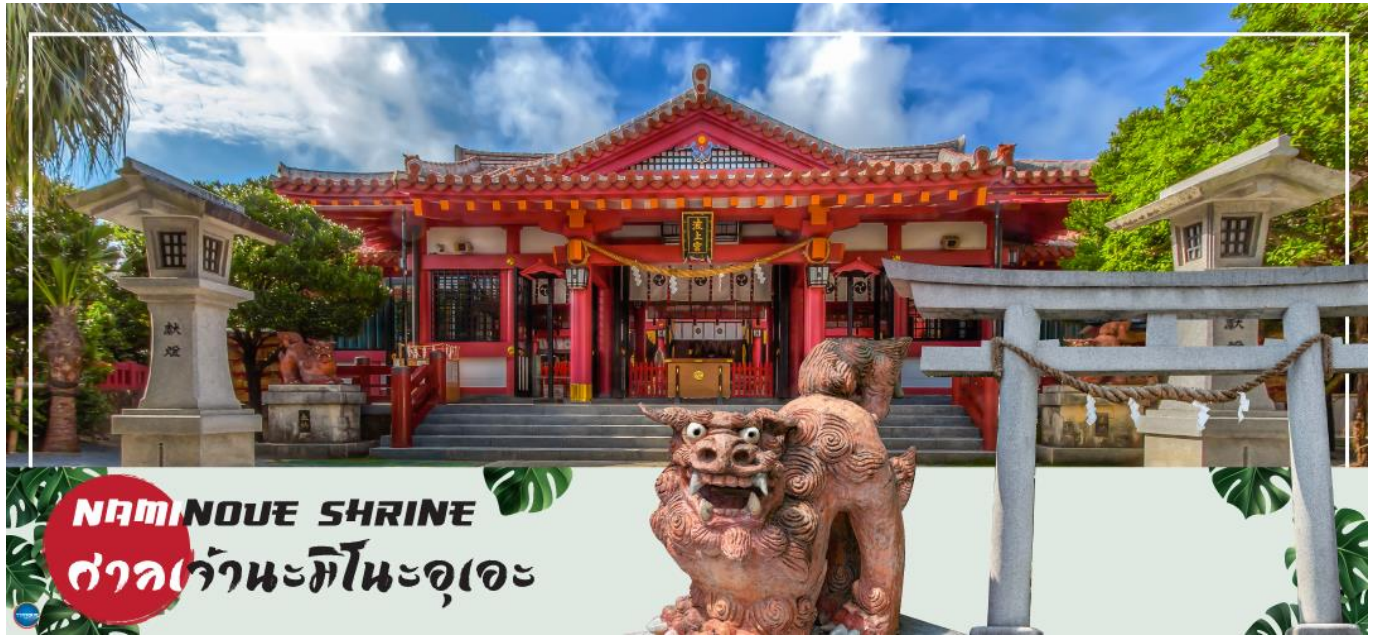
NAMINOUE SHRINE ศาลเจ้านะมิโนะอุเอะ

วันที่สี่ ศาลเจ้านามิโนะอุเอะ – อาชิบิโนะ เอาท์เลตมอลล์ – ทำอากาศยานนาสะ โอกินาวา – ทำอากาศยานดอนเมือง กรุงเทพฯ