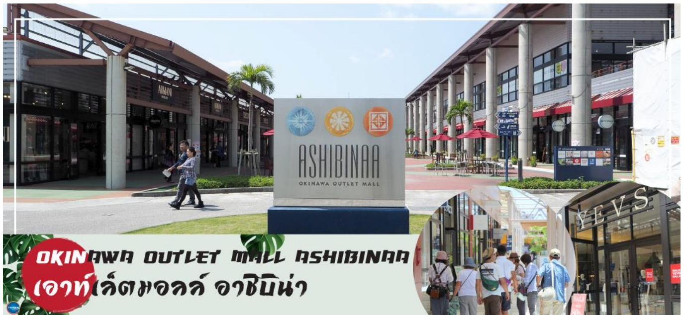
OKINAWA OUTLET MALL ASHIBINAA เอาท์เล็ตมอลล์ อาชิบิโนะ

จากนั้นนำท่านสู่ เอาท์เล็ตมอลล์ อาชิบิโนะ (Okinawa Outlet Mall Ashibinaa) (ใช้เวลาเดินทางประมาณ 30 นาที) เอาท์เล็ตแห่งแรกในโอกินาวะ รวบรวมร้านค้าชั้นนำกว่า 100 ร้าน ทั้ง