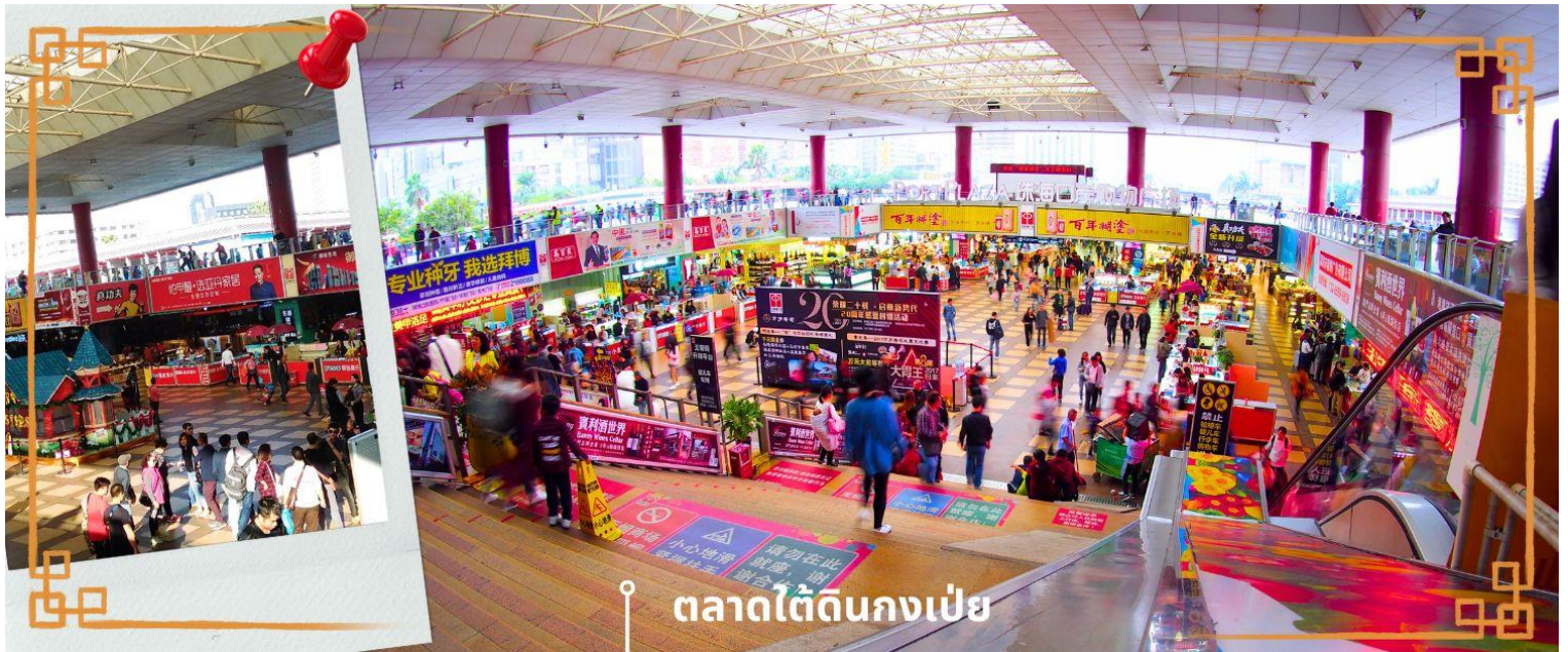
ตลาดใต้ดินกงเป๋ย

จากนั้นนำท่าน อิสระช้อปปิ้งตลาดใต้ดินกงเป๋ย ตั้งอยู่ติดชายแดนมาเก๊า เป็นศูนย์การค้าติดแอร์ ที่มีร้านค้ามากกว่า 5,000 ร้านค้า มีสินค้าให้ท่านเลือกมากมาย เช่น สินค้าก๊อปปี้แบรนด์เนมต่างๆ ไม่ว่าจะเป็นเสื้อผ้า รองเท้า กระเป๋า นาฬิกา ของเด็กเล่น ฯลฯ ที่นี่ มีสินค้าให้เลือกซื้อหลากหลาย จึงเป็นที่นิยมมากของชาวมาเก๊า และฮ่องกง เนื่องจากสินค้าที่นี่มีคุณภาพและราคาถูก