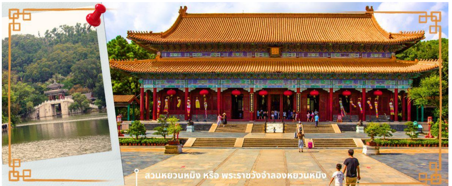
สวนหยวนหมิง หรือ พระราชวังจำลองหยวนหมิง

จากนั้นนำท่านสู่ ร้านหยก หยกในจีนโบราณจนมาถึงสมัยนี้ ยังมีความเชื่อว่าเป็นอัญมณีที่ล้ำค่าและหายาก บ่งบอกฐานะของสตรีในสมัยก่อน แต่ในสมัยนี้ เชื่อกันว่าหยกสีเขียวนั้นเหนี่ยวนำโชคและความร่ำรวย ดังคำกล่าวที่ว่า“สีเขียวเหนี่ยวทรัพย์” ถือเป็นการเสริมดวงจัญที่ดีของผู้สวมใส่อิสระให้ท่านได้เรียนรู้ชนิดของหยกและเลือกซื้อตามใจชอบจากนั้นนำท่านสู่ สวนหยวนหมิง หรือ พระราชวังจำลองหยวนหมิง ตั้งอยู่ ณ ใจกลางหุบเขาซิลิน เมืองจูไห่ สร้างขึ้นเลียนแบบพระราชวังหยวนหมิง ณ กรุงปักกิ่ง สิ่งก่อสร้างต่างๆ มากกว่า 100 ชิ้น มีขนาดเท่าของจริงในอดีตทุกชิ้น อาทิ เสาหินคู่ สะพานข้ามธารทอง ประตูต่างง ตำหนักเจิ้งตำกวางหมิง สะพานแก้วเลี้ยงสวนแห่งนี้โอบล้อมด้วยขุนเขาที่เขียวชอุ่ม และมีพื้นที่ครอบคลุมทะเลสาบขนาดมหึมา ซึ่งมีขนาดเท่ากับสวนเดิมในกรุงปักกิ่ง และยังมีกรเพิ่มเติมและตกแต่งสวนที่เป็นศิลปะแบบตะวันตกผสมกับศิลปะจีน