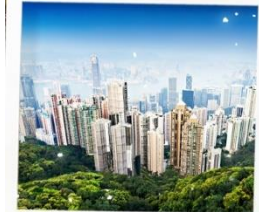
จุดชมวิวยาววิคตอเรีย