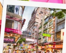
ฮ้อปบั้งย่านมงก๊ก