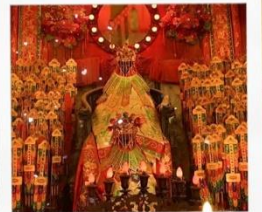
เจ้าแม่กวนอิมวัดสองฮ้า