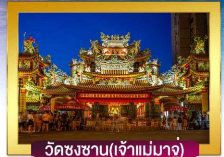
วัดชงซาน(เจ้าแม่มาจู่)