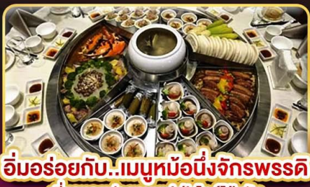
อิ่มอร่อยกับ..เมนูหม้อหนึ่งจักรพรรดิ เสี่ยวหลงเปา ซาบูบุฟเฟ่ต์สไตล์ไต้หวัน