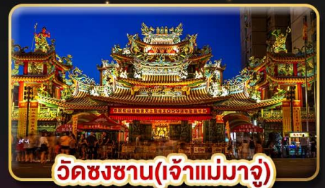
วัดชงชาน(เจ้าแม่มาจู่)