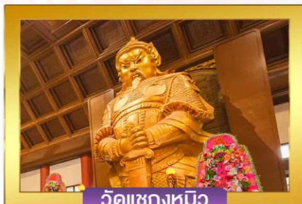
วัดแซงกงหมิว