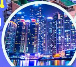
The Bay 101