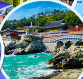
วัดแฮดง ยงกุงซา