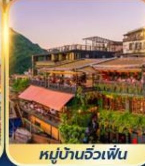
หมู่บ้านจิวเฟิ่น