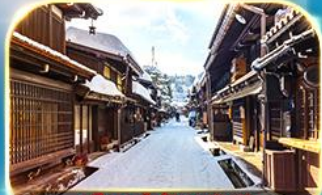
เมืองเก่าชินมาชิซูจิ