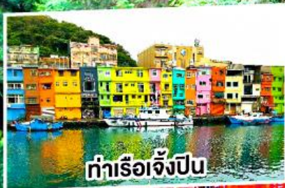
ท่าเรือเจิ้งปิ่น