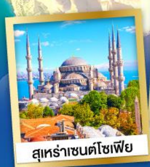
สุหร่าเซนตโซเฟีย