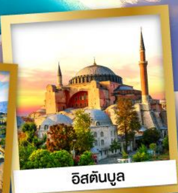
อิสตันบูล