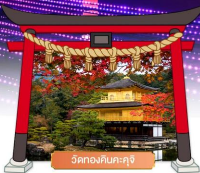
วัดคองคินคะคุจิ