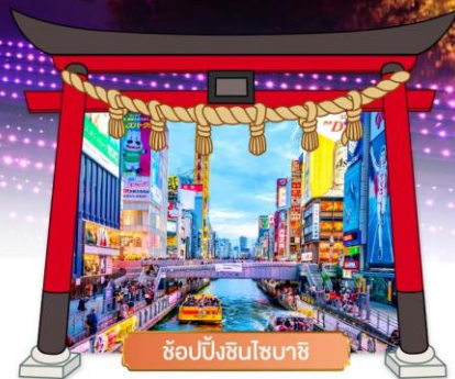
ช้อปปิ้งชินไซบาชิ

เดินทางโดยสายการบิน : ไทยแอร์เอเชียเอ็กซ์