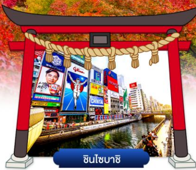
ชินโซบาชิ