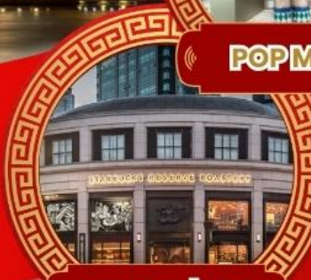
สตาร์บิคเชียงใหม่