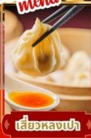
เสี่ยวหลงเป่า