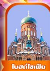
โบสถ์โซเฟีย