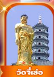
วัดจีเล่