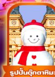
รูปปั้นตุ๊กตาหิมะ

เที่ยวฟิน 7 วัน 5 คืน ธันวาคม 67 - กุมภาพันธ์ 68