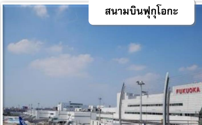
สนามบินฟูกูโอกะ

บริการอาหารร้อนบนเครื่องพร้อมกับเมนูผลไม้สดเพื่อเติมเต็มความพิเศษไปพร้อมกับความสดชื่น