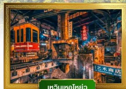
เหวินเหอไห่ยว่