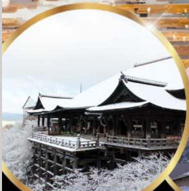
วัด คิโยมิสึ