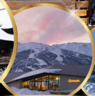
Snow peak land hukuba