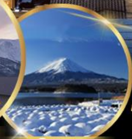
สวน โออิชิ พาร์ค