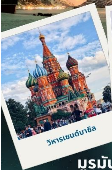
วิหารเซนต์บาซิล