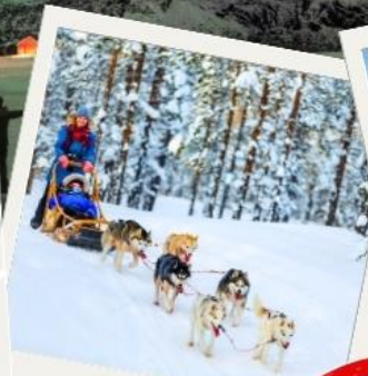
สุนัขฮัสกี้ลากเลื่อน