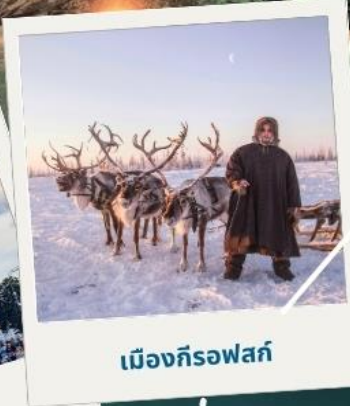
เมืองก็รอฟสค์