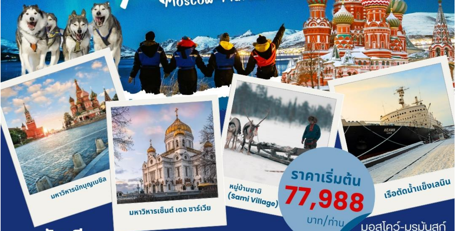
มหาวิหารนักบุญเบซิล